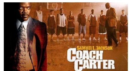
映画を観て学ぶ ストーリーメソッド®

理由③ 書き込み式のテキストがあなたのバイブルになる ゲームや演習を通じて、記入をするだけで、あなただけの リーダーシップのバイブルが完成し、復習しやすい